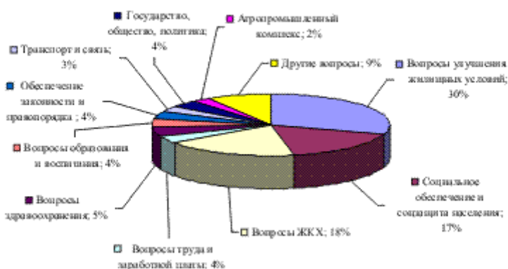
Соотношение по тематике обращений

Квартирный вопрос - лидер в обращениях астраханцев – он волнует 2017 жителей области. По данной тематике поступило и больше всего повторных обращений – 495.